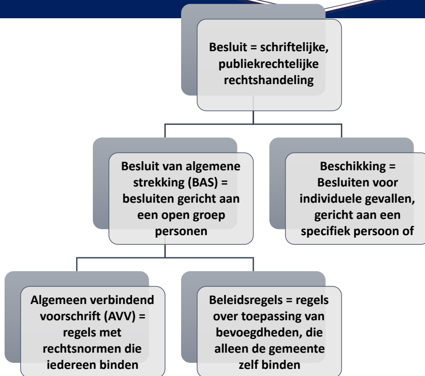
Tabel 4.2 – Overzicht besluiten van bestuursorganen 56

In het BVR mogen alleen algemeen verbindende voorschriften worden opgenomen. Beschikkingen en beleidsregels mogen dus niet worden opgenomen in het BVR. Het moet namelijk gaan om regels die alle burgers direct binden of regels waar alle burgers rechten aan kunnen ontlelen. Dit is bij beschikkingen, die niet alle burgers binden maar slechts een persoon of een groep, en beleidsregels, die alleen de gemeente binden en niet de burgers, niet het geval.